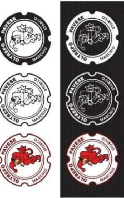
A colori su nero